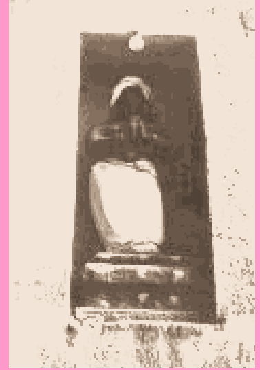
அருணாசலேஸ்வரா ஆலயத்தில் உள்ள கோபுரத்தில் உள்ள மன்னன் வல்லாளனுடைய உருவச் சிலை

1291 ஆம் ஆண்டில் நரசிம்மன் இறந்து போனார்.