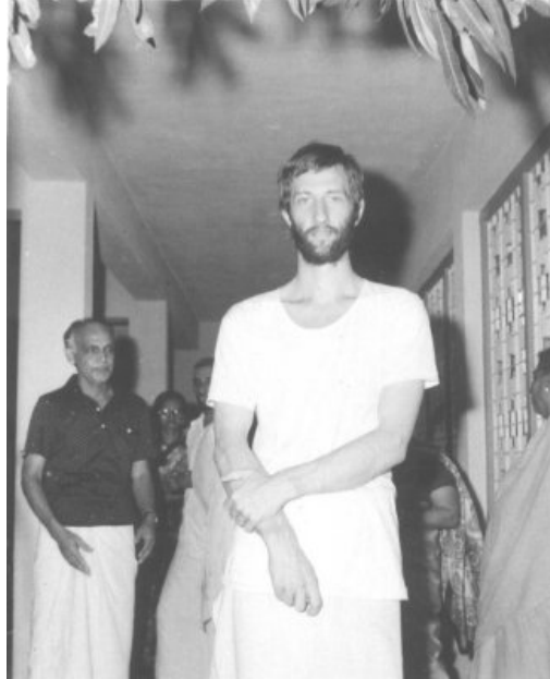
1981 ஆம் ஆண்டில் பனியன் வேட்டியுடன் புதிய இரமணாஷ்ரம வாசகசாலைத் திறப்பு விழாவில் நான்

சில மாதங்களாக இருந்தப் பின் மீண்டும் நான் அந்த பாழடைந்த ஆலயத்தில் குடியேற முடியாது என்பதை உணர்ந்தேன். ஆகவே அங்கு சென்று படுக்கை, சமையல் பாத்திரங்கள், புத்தகம் மற்றும் சில துணிகளை என்னுடன்