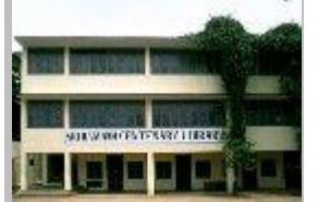
இரமணாசிரமத்தில் 1978 முதல் 1985 ஆம் ஆண்டுவரை நான் நிர்வாகித்த வாசகசாலை

அருணாசலாவைச் சுற்றிய பகுதி புனிதமானது. கால்களில் பாதணி இல்லாமல் நடக்க வேண்டும். ஐரோப்பியர்கள் அப்படி நடைப் பயணத்தை மேற்கொண்ட பொழுது அவர்கள் கால்கள் இரணமாகி விடும். ஆனால் மீண்டும் சில நாட்களுக்குப் பிறகு அது பழகிவிடும்.